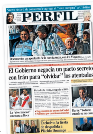
PRIMICIA. Tapa de PERFIL del 26 de marzo de 2011, con la nota de Pepe.

Intuyo que ahora tendría una mueca irónica al leer sobre las novedades de “su” tema. Y, exigente como era con los estándares profesionales, se disgustaría un poco con algunas reivindicaciones hipócritas. También, con ciertos profesionales que deberían explicar sus vínculos con la ex SIDE y el rol que tuvieron en la escandalosa e inconducente investigación del peor atentado terrorista de la historia argentina. ■