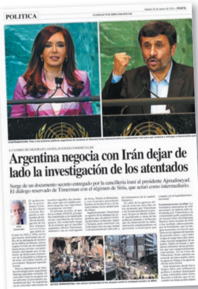
COINCIDENCIA. El adelanto de Eliashev, cuatro años atrás.

mento, porque piensan que todo eso forma parte de una negociación política, varias veces me lo sugirieron, incluso con otros gobiernos argentinos: si el presidente de Irán da una orden y el nuestro otra. Me lo han dicho públicamente en las reuniones de Interpol y se lo han expresado al secretario general, y así les ha ido, desastrosamente, en los planteos que han tenido. Creen que todo se maneja como lo hace su gobierno teocrático, donde el líder espiritual dice algo y todo el mundo obedece.