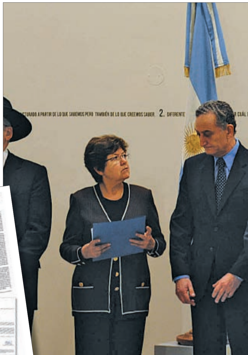
SEPTIEMBRE DE 2010. El canciller visita la reinaugurada AMIA

A todo esto, el ministro arrastra una desventaja extra que proviene de su apellido. Los más veteranos de la Cancillería israelí aún recuerdan de muy mala forma el paso de Jacobo Timerman por el país, cuando el Estado judío lo rescató de las manos