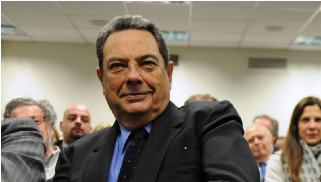
Abel Posse, ex ministro de Educación